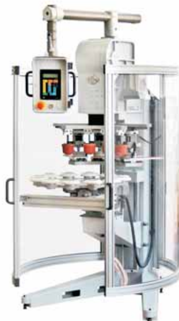
Logica Micro II